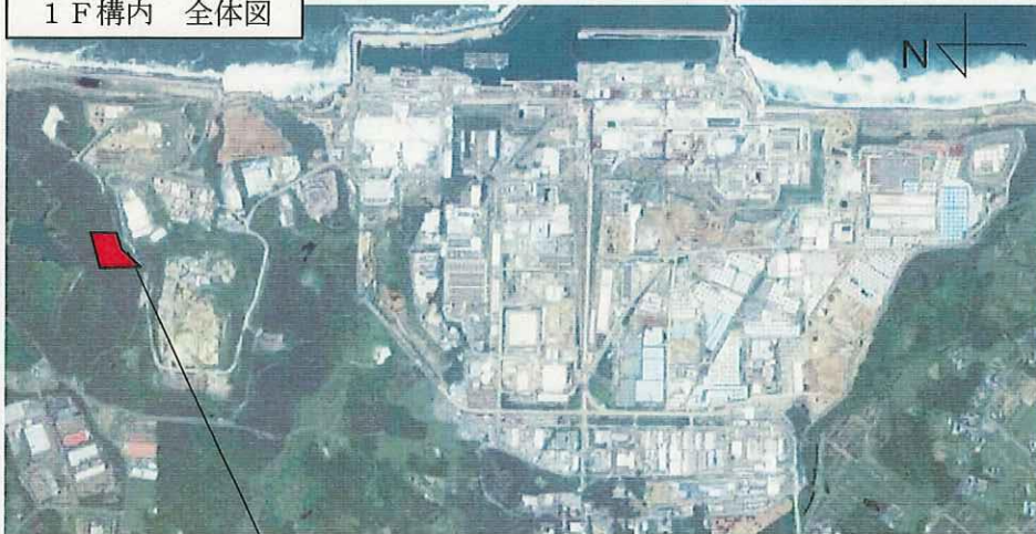
1 F 構内 全体図