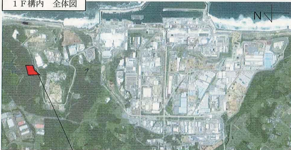
1 F 構内 全体図