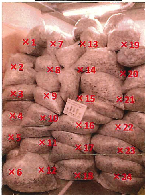
シュレッダー屑 表面線量率測定結果 ( \mu\text{Sv/h} )