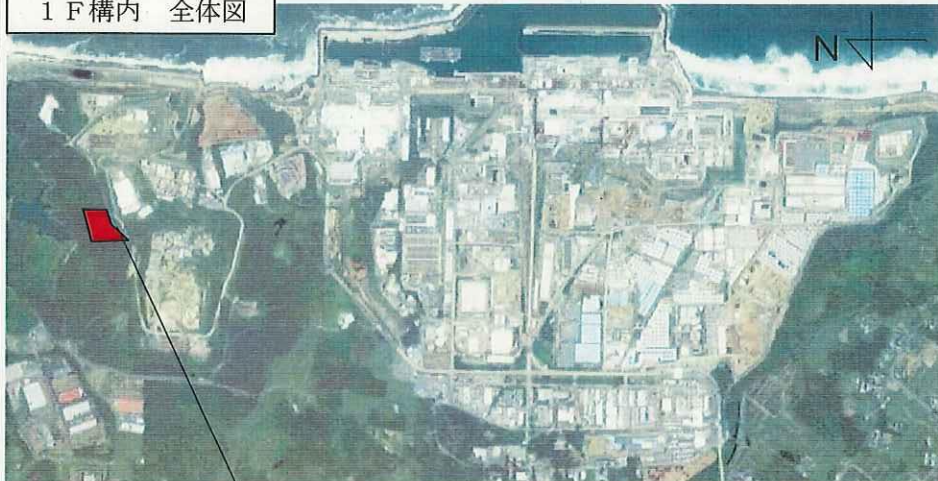
1 F 構内 全体図