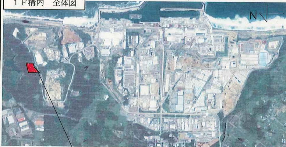
1 F 構内 全体図