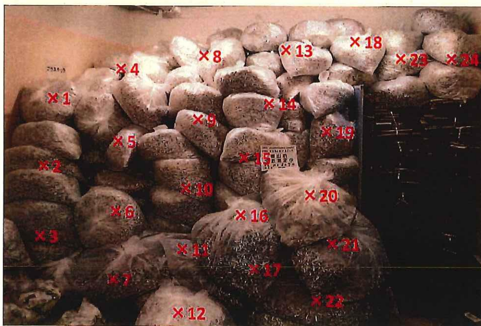
シュレツダー屑 表面線量率測定結果 ( \mu\text{Sv/h} )

測定器: F1-SC-137 時定数: 10 sec B G : 0.07 \mu\text{Sv/h}